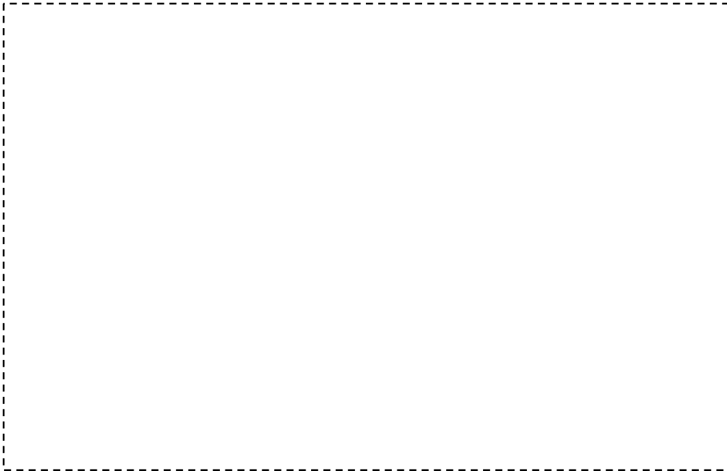
รูปที่ 1 สภาพด้านหน้าบ้านผู้สมัคร

รูปถ่ายภาพบ้านที่อยู่อาศัยและทรัพย์สินของครอบครัวผู้สมัคร ให้ผู้สมัครติดรูปภาพตามที่กำหนดดังนี้ (ถ้ามีรูปมากกว่านี้ให้ส่งมาพร้อมใบสมัครได้)